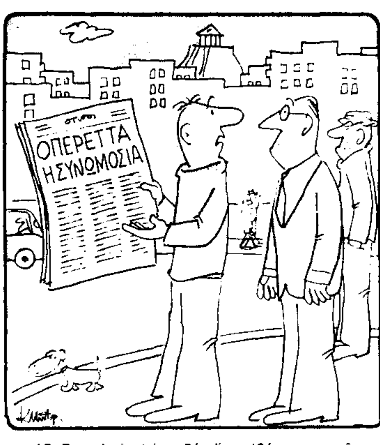
Ο Βασιλιάς λέει, δεν έχει ιδέα μουσικής...