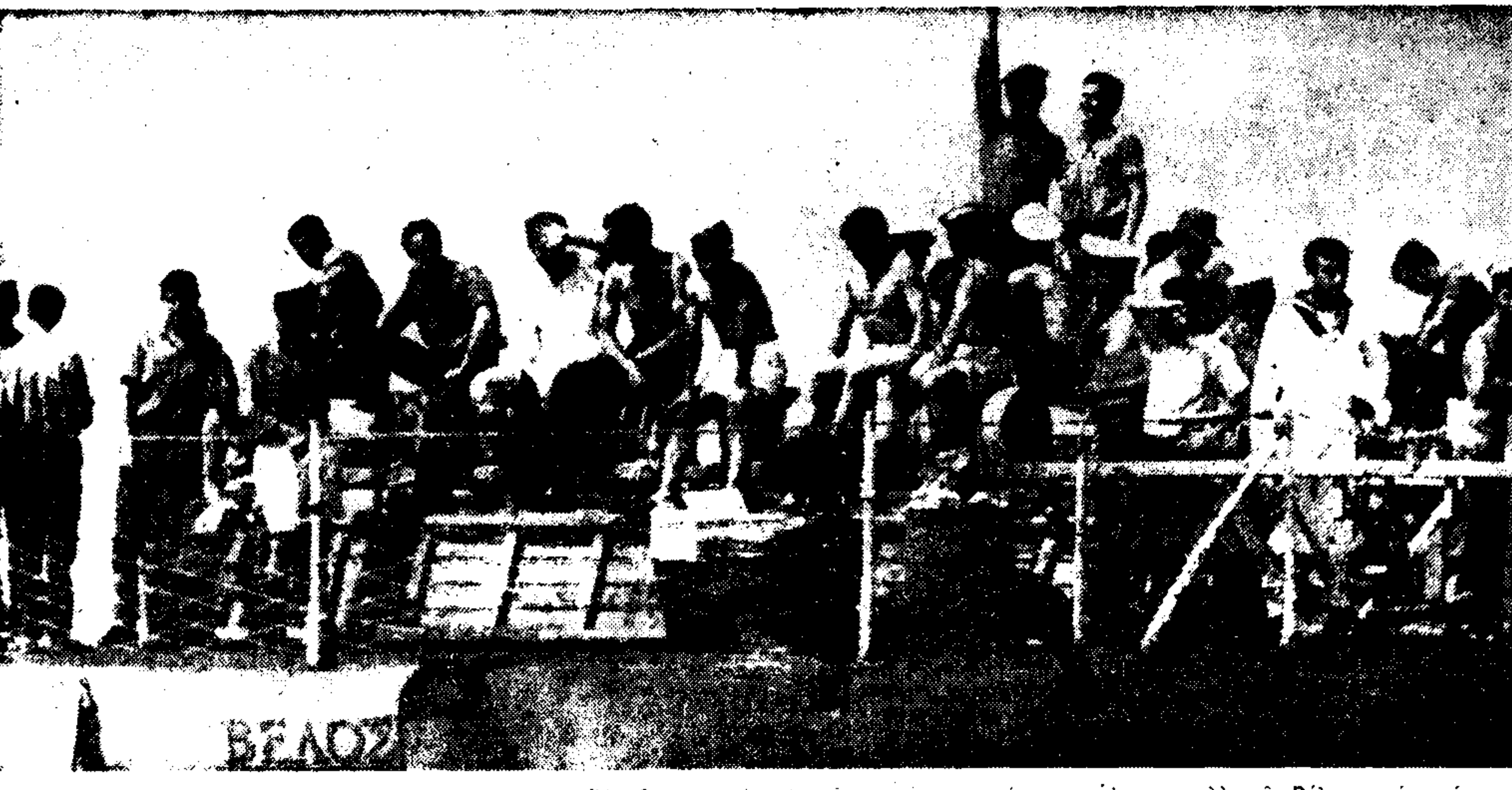
Υπαξιωματικοί και ναύτες του κατασείσαντος αντιτορπιλικού «Βέλος»...